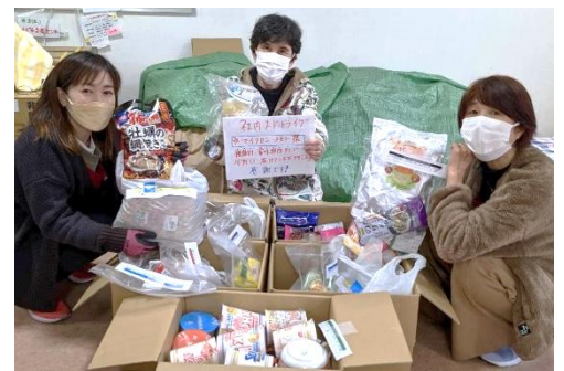
食品は、食品の種類、賞味期限ごとに整理されて、あいあいねっとに届きました！お心遣いありがとうございます！！