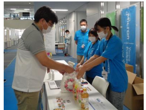
社内フードドライブの様子

マイクロでは、今後もこの活動を通じて、地域社会に貢献していきたいと考えています。