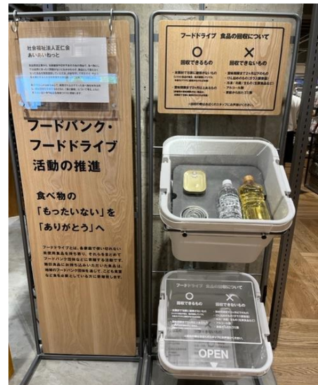
フードドライブ回収ボックス！！

【良品計画株式会社】 様は、今年のゴールデンウィークにオープンした、世界最大級の売り場面積を誇る、無印良品アルパーク店にて、フードドライブのコーナーを設け、あいあいねっとに食品を提供していただいています。また、6月19日（日）には、食品ロス削減をテーマにしたコラボイベントを開催しました。アルパーク店の1階と2階を会場に、食品ロス削減をテーマにしたクイズスタンプラリーを行いました。食品に関するクイズを6問解いて、スタンプを集めてフロアを回ります。クイズの答えを手掛かりに、今日から取り組む食べ物を食べきる工夫「食品ロス削減宣言」を紙に書いてもらい、展示をしました。小さなお子さまからお年寄りまで